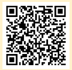
「ラーケーションの日」活動例